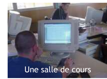
Une salle de cours